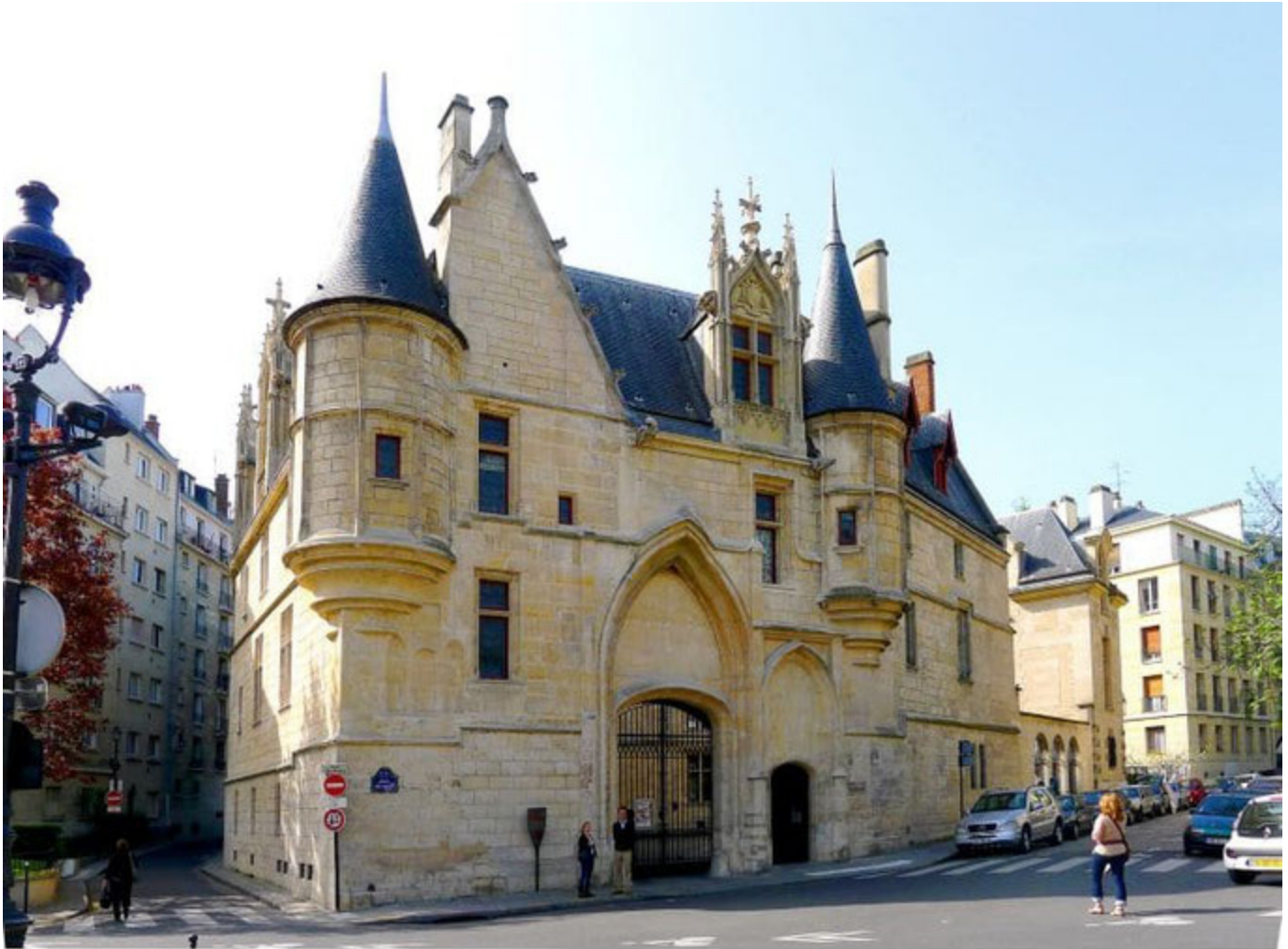
Hôtel de Sens

Übrigens: Die Bezeichnung "Hôtel de..." heißt in diesem Fall nicht, dass ihr dort übernachten könnt. Es handelt sich hierbei um die "Hôtels particuliers", was die französische Bezeichnung für Stadtpalast ist.